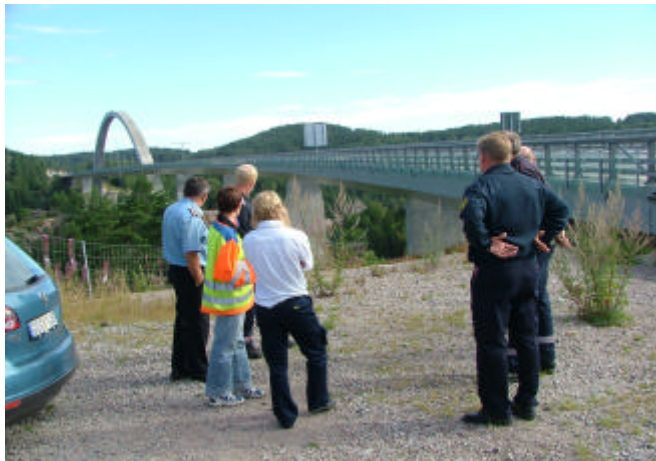
Bild1: Gränsöverskridande orientering vid gemensamt riskobjekt, 2007-07-31.

Då Strömstads Räddningstjänst och Haldens Brannvesen samarbetar vore det lärorikt och givande för båda parter att tillsammans gå igenom hela handlandet, från larm till återställande på station, olika typer av troliga och gemensamma olyckor. Sannolika scenarion är bland annat trafikolycka, större fastighetsbrand, fartygsolycka, drunkningsolycka samt någon typ av olycka på Svinesundsbron.