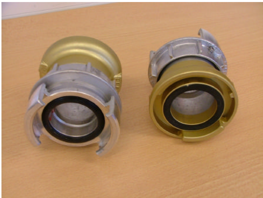
Bild 2: Övergångskopplingar, svensk koppling i ena änden och norsk i andra.

Av största vikt är också att utveckla ett effektivt och användbart sambandssystem (se inledningen, sid 4) för både Strömstads Räddningstjänst och Haldens Brannvesen.